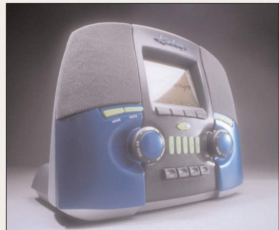
A nagy vetélytárs, a Kerbangó

Célkitűzésünk az, hogy még ebben az évben elinduljon a szolgáltatás. Ha azonban azt szeretnénk, hogy a számítástechnikában járatlan felhasználók is boldogulhassanak vele, akkor még sok egyszerűsítést kell végrehajtani. Az emberek elvárják egy rádiótól, hogy ha bekapcsolják,