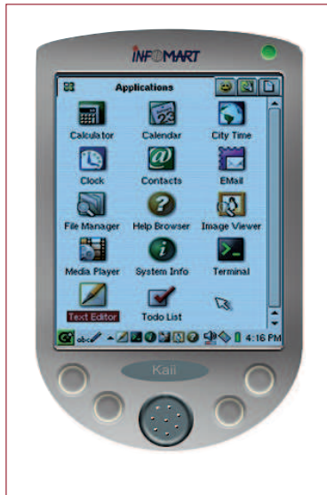
A Kaii névre hallgató linuxos zsebtitkár