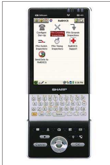
Sharp Zaurus SL-6000 PDA