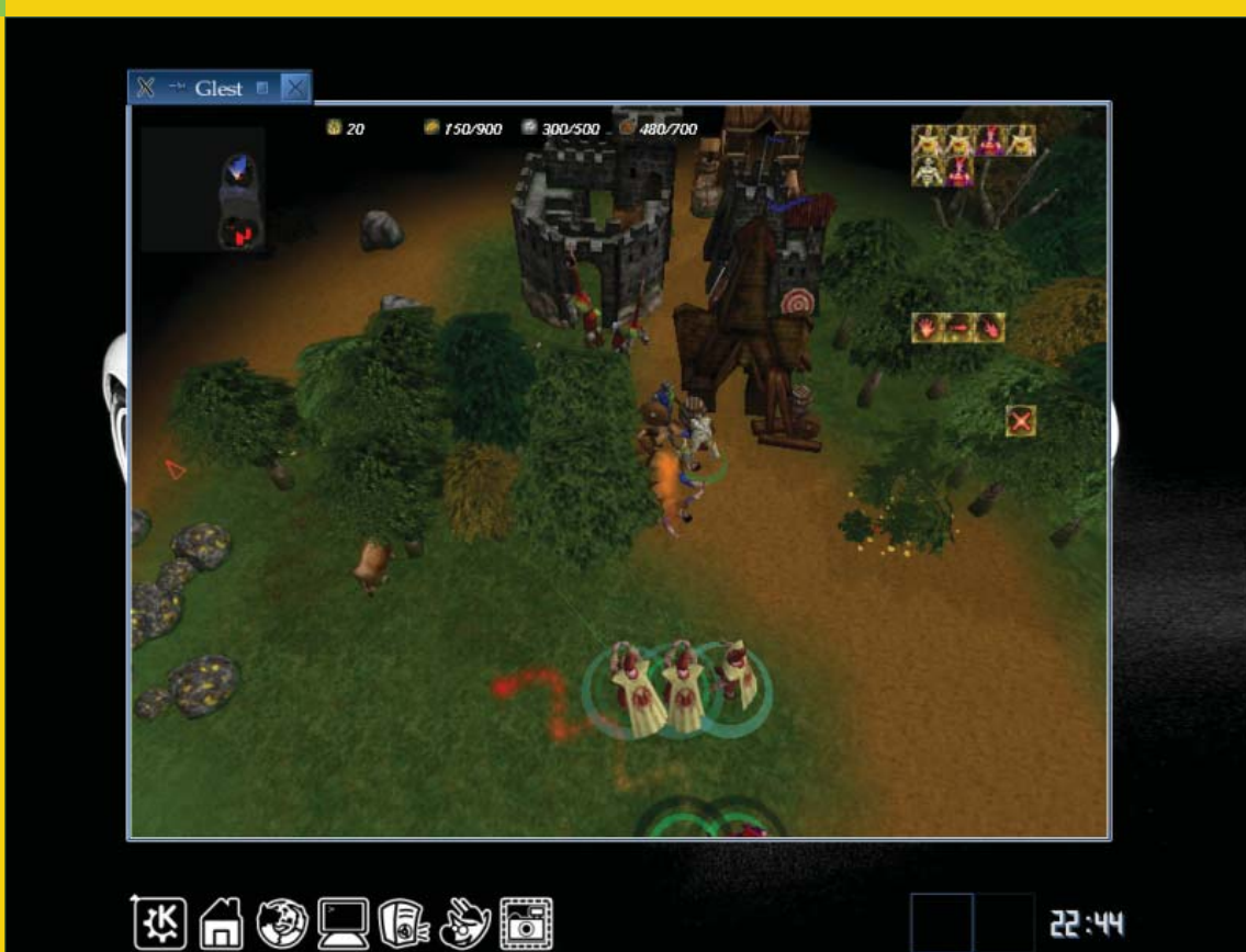
3. ábra A Glest működés közben

ezért a működő GLX/DRI kapocs itt alapfeltétel. A kód a Simple DirectMedia Layer könyvtárakat használja, így SDL környezetünket ajánlott naprakészen tartani. A linuxos játék tulajdonképpen nem különböztethető meg a jóval kiforrottabb Windows verziótól ami nem rossz ajánlólevél. A játék menetét tekintve nem a véletlen műve az említett kitévés, a Homeworld ugyanis hemzseg a jó ötletektől. Személy szerint kifejezetten imádom nézni, ahogyan térugrás előtt minden vadászom, az összes technikám „libasorban” visszatér a vezérgépre.