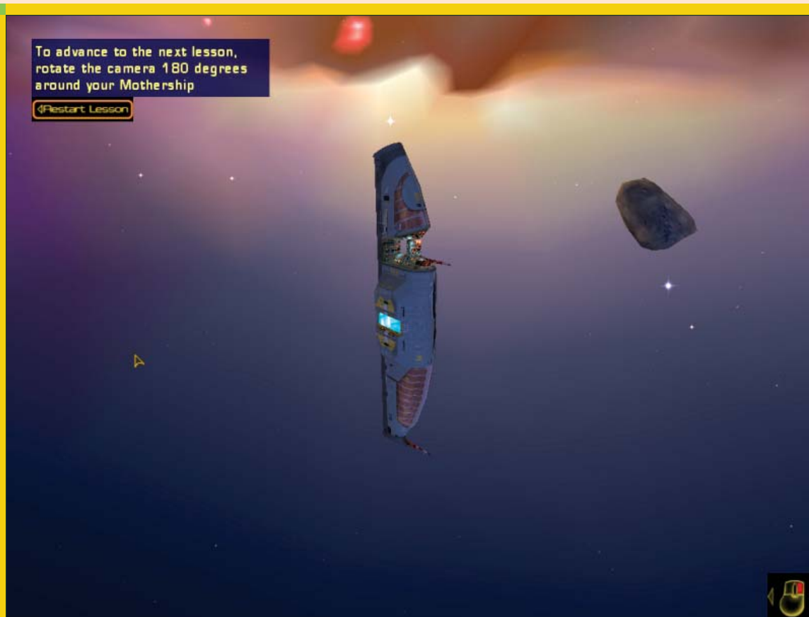
2. ábra A Homeworld csodaszép világa

kelti életre. Futtatás idejére már nem szükséges a Win32 játéklemez jelenléte hacsak nem szeretné valaki hallgatni a zenekari audiosávokat. Természetesen az engine elérhető forrásként is, így akinek nem tetszik a bináris megoldás, az le is fordíthatja magának a kódot ( ./configure , make depend , make ) – viszont az említett telepítési mód kellőképpen egyszerű és hibalehetőségektől mentes. A játék kellemesen nehéz, kicsi hardverigényű, grafikája „2D retro art” jellegű. Annak ellenére, hogy nem a Blizzard hivatalos megvalósításáról van szó, mindenképpen linuxos gépünkön a helye!