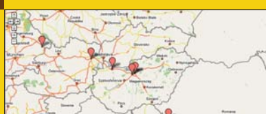
■ 1. ábra Azon tanulók, akik a PlanetSoC weboldalon regisztrálták magukat. Lapzártá előtt nem állt rendelkezésre a tavalyihoz hasonló teljes térkép