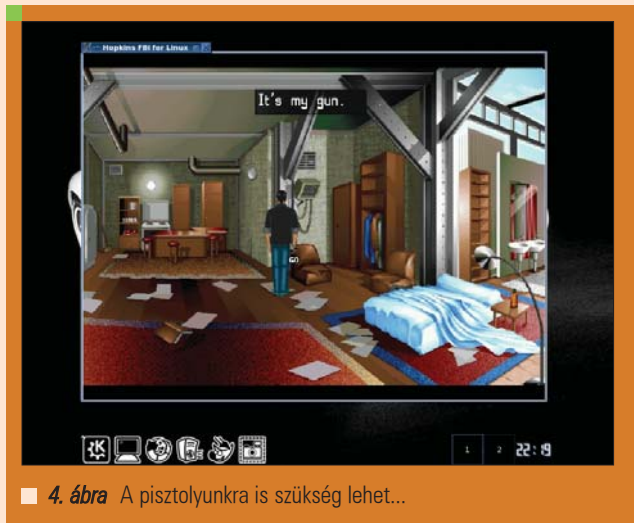
■ 4. ábra A pisztolyunkra is szükség lehet...

bármely helyszínen lehetőségek egész tárháza adódik a felhasználó előtt, egyik megoldás pedig a következőnek igen sokszor a kulcsát jelenti: ebben az összetettségben rejlik a játék sava-borsa. Fontos lehet, hogy a Hopkins FBI világa nem szűkölködik a véres jelenetekben, így csak bizonyos korhatár betartásával érdemes foglalkozni vele. A fejlesztői munkák az MP Entertainment csapatához fűződnek.