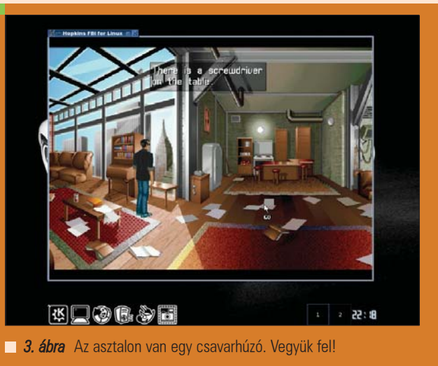
■ 3. ábra Az asztalon van egy csavarhúzó. Vegyük fel!